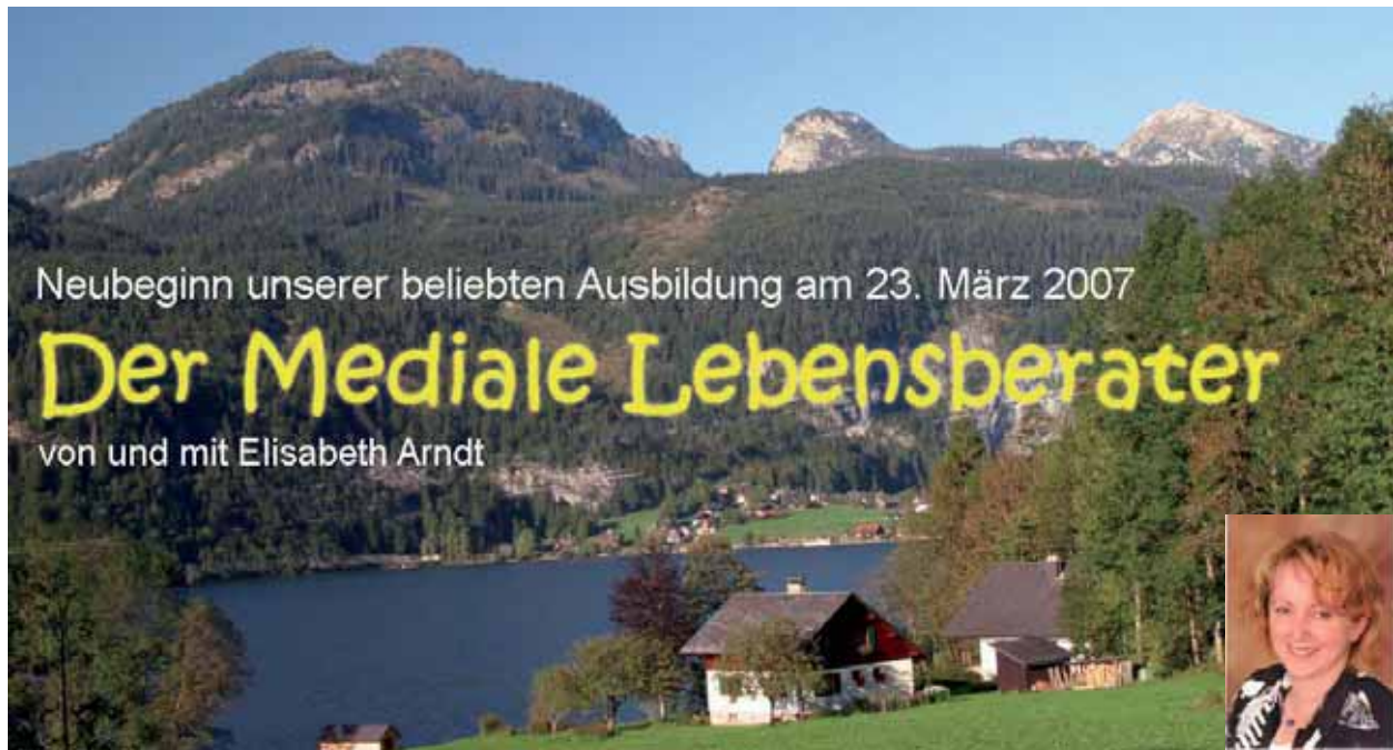
Unser Seminarort Grundlsee