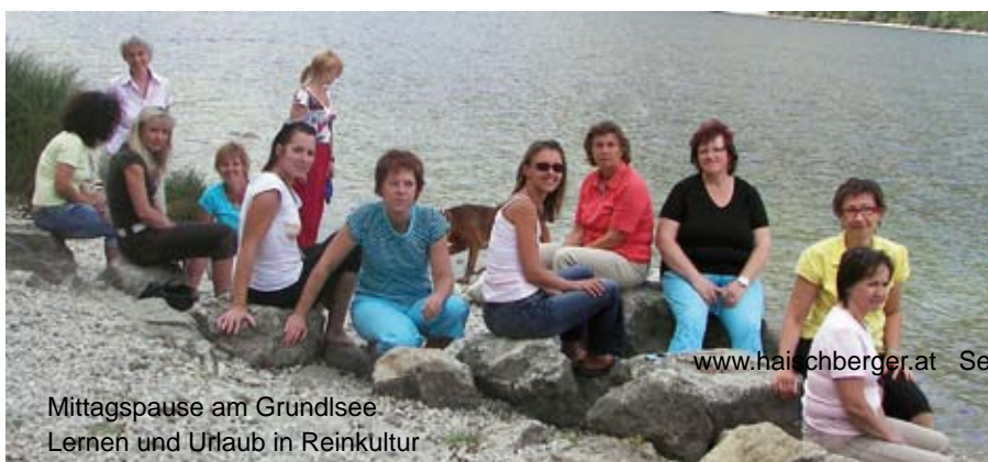
Mittagspause am Grundlsee Lernen und Urlaub in Reinkultur