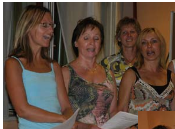
Danke für das herrliche Fest!

So gab es eine wunderbare Arbeit die voll und ganz der Arbeit mit Glaubenssätzen gewidmet war. Sie macht total aufmerksam wie wir denken und auch was wir ÜBER UNS denken. Einige haben ausführlich über die Meridiane und Chakren geschrieben. Viele mit Erfahrungsberichten aufgewartet. Aber auch die Heilwässer und über den Kubus gab es Arbeiten. Wirklich sehr erstaunlich.