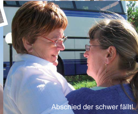
Abschied der schwer fällt!