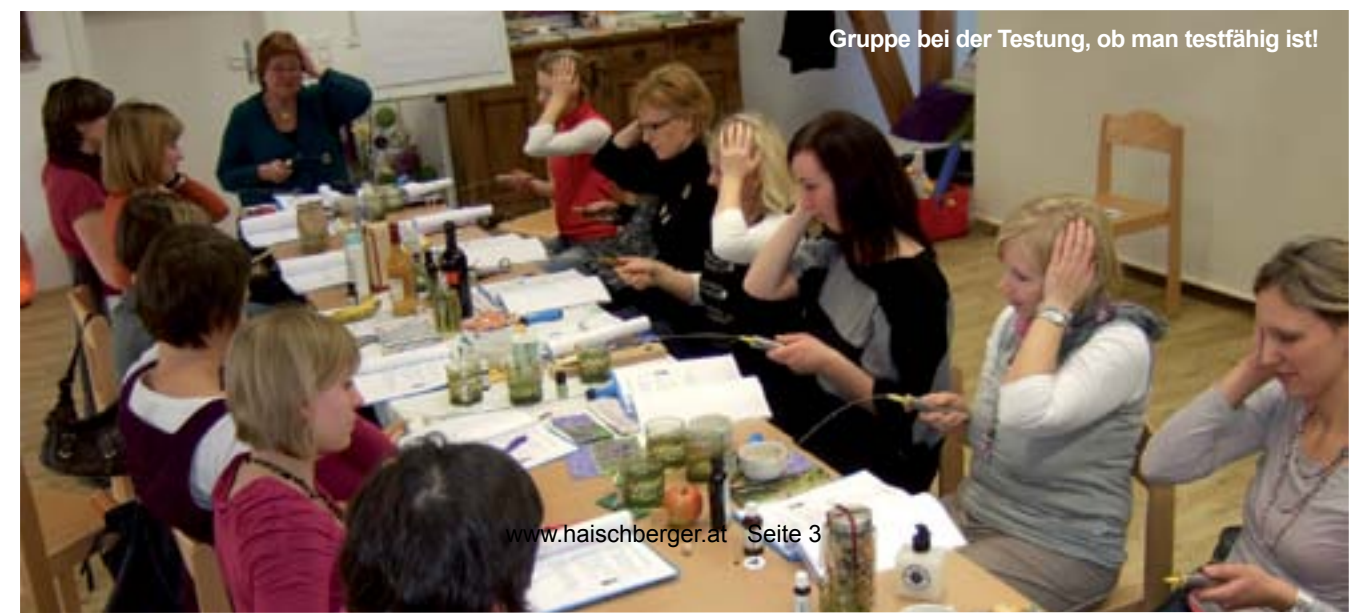
Gruppe bei der Testung, ob man testfähig ist!

19.-20. Nov. Was sagen deine Träume mit Heliamus Krenglbach