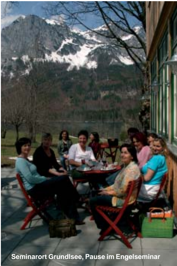
Seminarort Grundlsee, Pause im Engelseminar

Aber sie zu finden oder auch sie zu leben ist ganz und gar nicht einfach! Es ist eher manchmal der