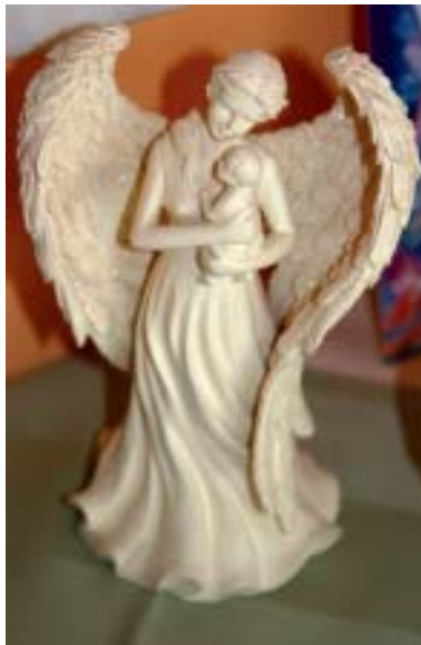
Engel aus dem wunderschönen Geschäft Carisma von Gerlinde Jaklitsch in Bad Aussee, Ischlerstrasse.

Über Engel lerne ich Teilaspekte des Allumfassenden kennen und kann zu ihnen eine persönliche und innige