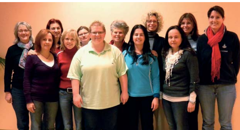
Wir gratulieren allen Holistic Pulsing Praktikern zur bestandenen Prüfung am Grundlsee

Genauere Infos für alle Holistic Pulsing Seminare: www.reisenachhause.at , oder 0676 600 27 33